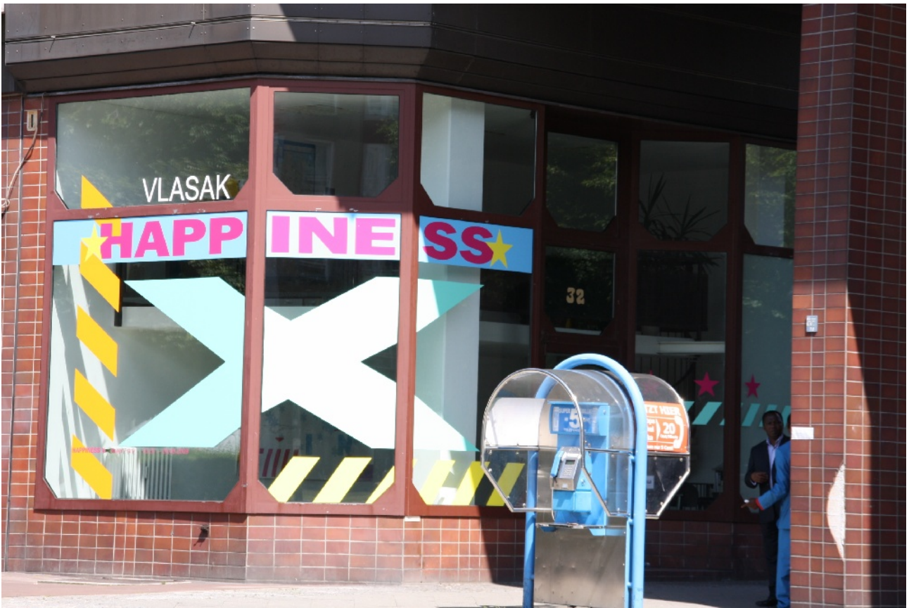
roger frank, happiness x, 2009 , site-specific art piece, plotterschrift, acrylfarbe, papier, offsetdrucke, maße ca. 15 x 4 x 4 m, 1.450,- € beinhaltet „the X“, „king pop“ und „happy clouds“ (zzgl. produktions- und installationskosten)